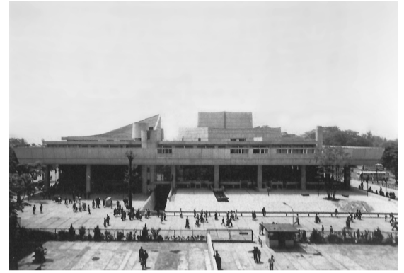
Kunio Maekawa Metropolitan Festival Hall, Tokyo 1960-1961