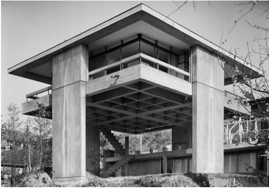
Kiyonori Kikutake Sky House, Tokyo 1957-1958