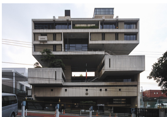
Kenzo Tange Kuwait Embassy, Tokyo 1968-1970