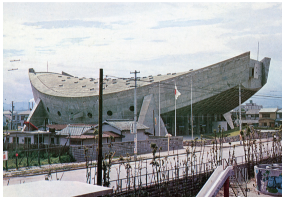
Kenzo Tange Kagawa Prefectural Gymnasium, Takamatsu 1962-1964