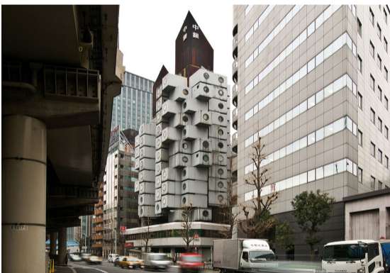
Kisho Kurokawa Nagakin Capsule Tower, Tokyo 1970-1972