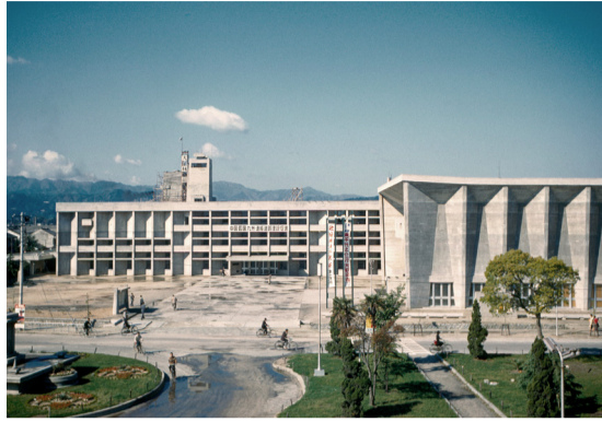
Kenzo Tange Imabari City Hall, Imabari 1957-1959