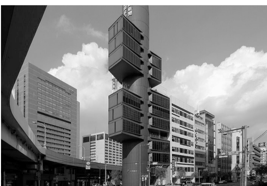
Kenzo Tange Shizuoka Broadcasting Center, Tokyo 1966-1967