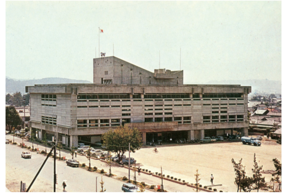
Kenzo Tange Kurashiki City Hall, Kurashiki 1958-1960