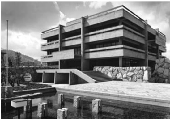
Yoshinobu Ashihara Kagawa Prefectural Library, Takamatsu 1962-1963