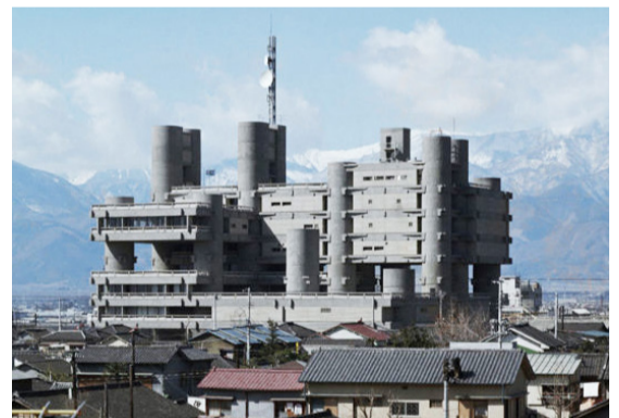
Kenzo Tange Yamanashi Broadcasting Center, Kofu 1964-1967