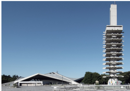
Yoshinobu Ashihara Komazawa Olympic Park, Tokyo 1962-1964