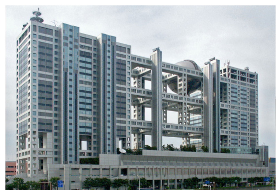
Kenzo Tange Fuji Television Building, Tokyo 1993-1996