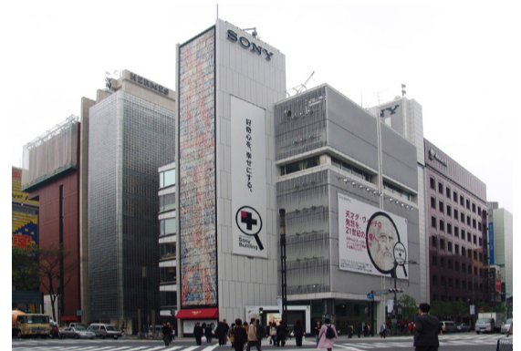
Yoshinobu Ashihara Sony Building, Tokyo 1964-1966