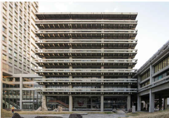
Kenzo Tange Kagawa Prefectural Hall, Takamatsu 1958-1960