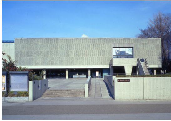
Le Corbusier, Junzo Sakakura Museum of Western Art, Tokyo 1958-1959