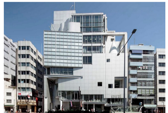
Fumihiko Maki Spiral Building, Tokyo 1983-1985