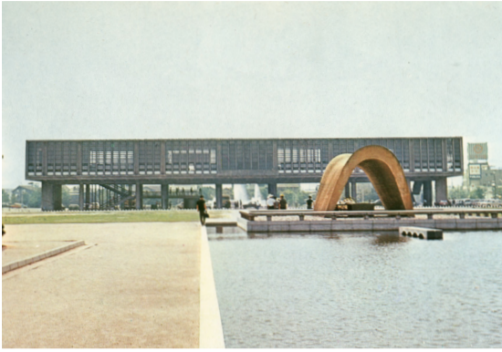
Kenzo Tange Peace Memorial Museum, Hiroshima 1954-1955